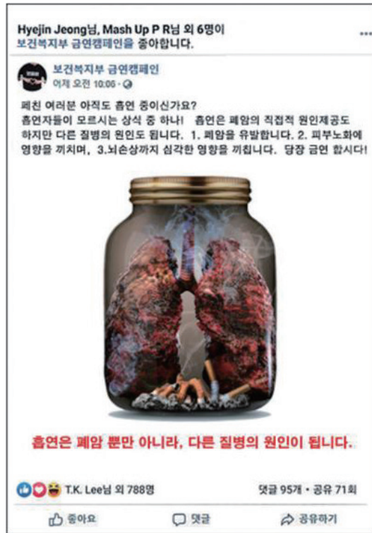
(1) 보건복지부의 금연광고 < 페이스북 광고 >