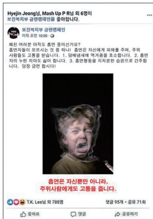
(3) 보건복지부의 금연광고 < 페이스북 광고 >